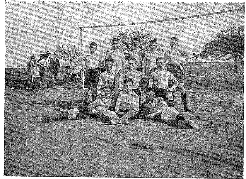
Mannschaft des DJK Ebersheim im Jahre 1925