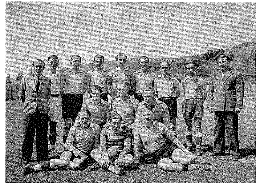
1. Mannschaft des TSV Mainz-Ebersheim 1947