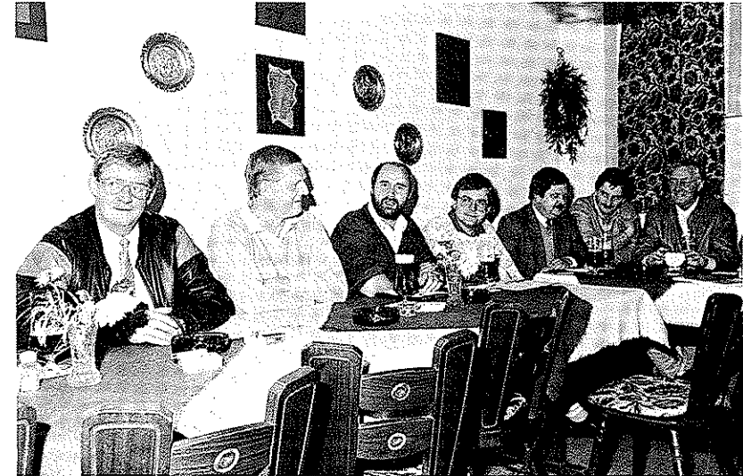
Vorbereitungsarbeit für die Kampagne: der Vorstand tagt.

Weg gewesen, von der Erkenntnis, für die Fastnacht in Mainz-Ebersheim etwas eigenes tun zu müssen, bis zur Realisierung des Vorhabens. Nach einer kurzen Aussprache stand dann fest: das „Kind“ heißt Ebersheimer Carneval-Verein 1987 – Die Römer –. Ziel und Schwerpunkt ist es, fastnachtliches Brauchtum durch Veranstaltungen zu pfl-