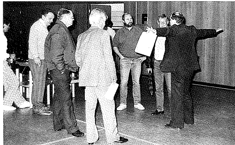
Schnapsschuß von einer Probe für das erste Eröffnungsspiel des EVC – Die Römer –.

Und natürlich gliedert sich der jüngste Ebersheimer Verein in das Vereinsleben des Stadtteils ein: er wird Mitglied des Vereinsrings werden.