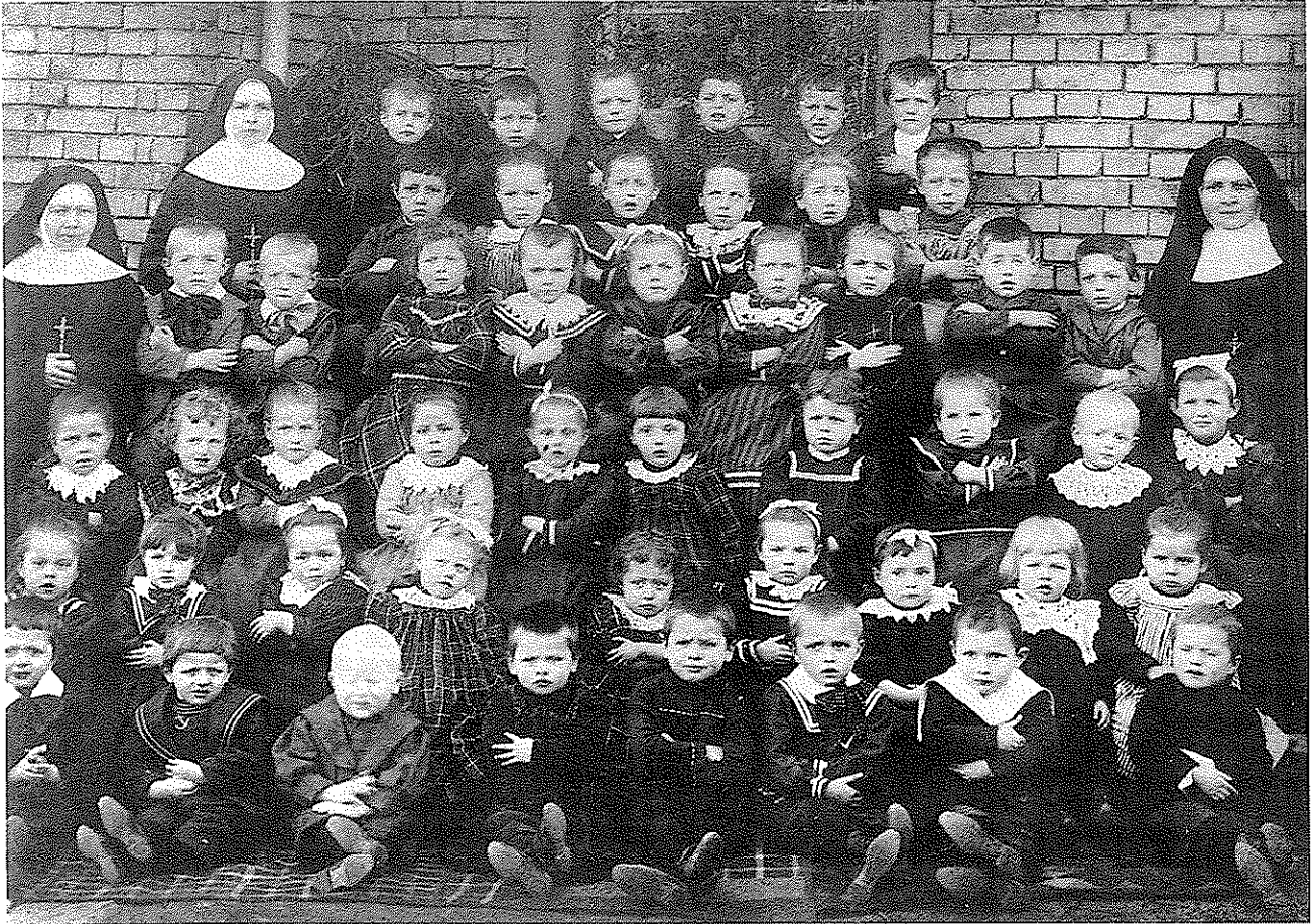
Die ersten Jahrgänge der Schwesternschule um 1897 nach Erbauung des Schwesternhauses 1894