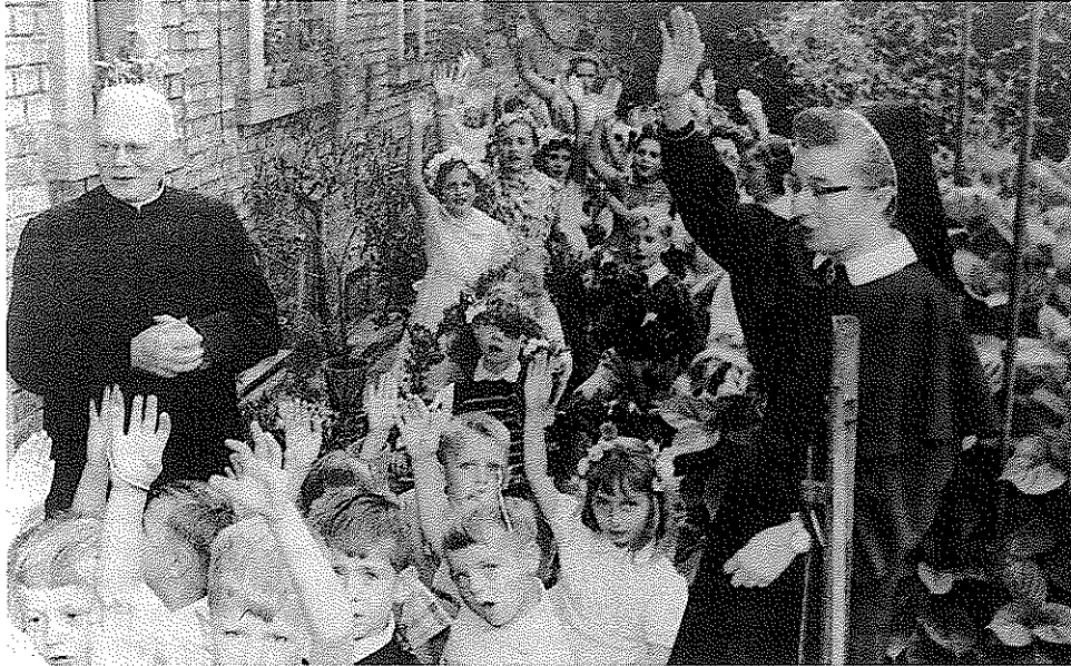
Links: Kindergarten-Sommerfest um 1955